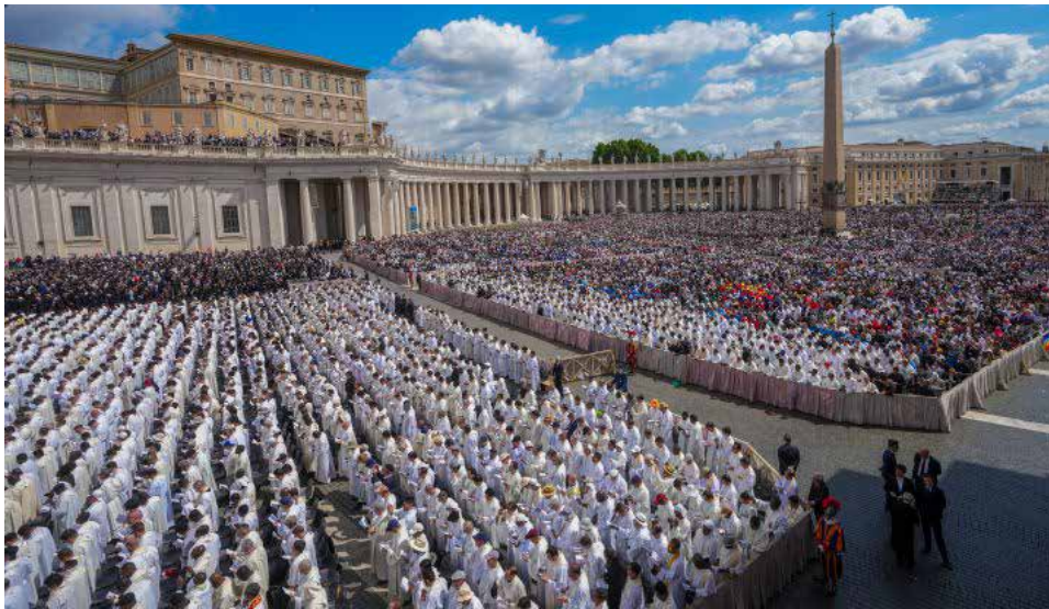
Vista general de la plaza de San Pedro durante la misa inaugural del sumo pontífice