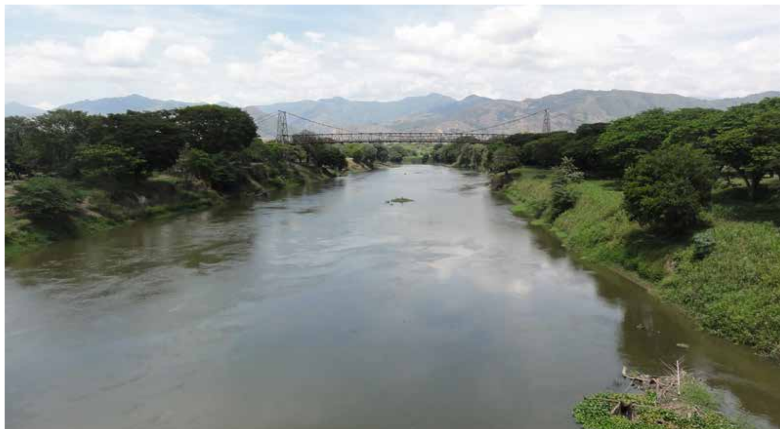
Río Cauca. Puente Anacaro Cartago – Ansermanuevo, Valle, Colombia.

El Colectivo Río Cauca, una plataforma inédita que reúne gremios, gobierno, academia y sociedad civil.