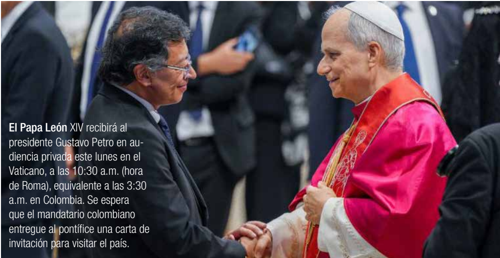
El Papa León XIV recibirá al presidente Gustavo Petro en audiencia privada este lunes en el Vaticano, a las 10:30 a.m. (hora de Roma), equivalente a las 3:30 a.m. en Colombia. Se espera que el mandatario colombiano entregue al pontífice una carta de invitación para visitar el país.

Este saludo inicial se prolongará hoy lunes 19 de mayo, cuando el Papa León XIV recibirá al presidente Petro en una audiencia privada, convirtiéndolo en uno de los primeros jefes de Estado en ser recibidos por el nuevo líder de la Iglesia Católica.