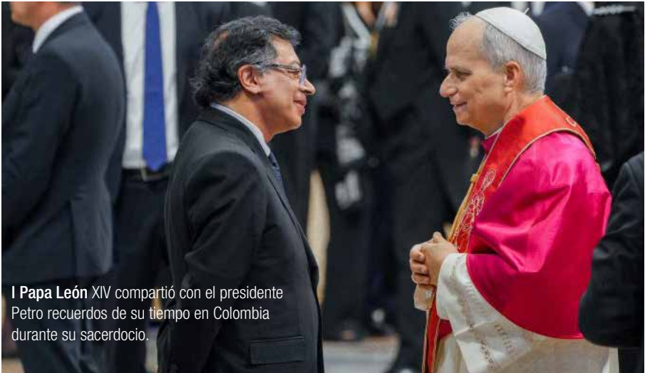
El Papa León XIV compartió con el presidente Petro recuerdos de su tiempo en Colombia durante su sacerdocio.