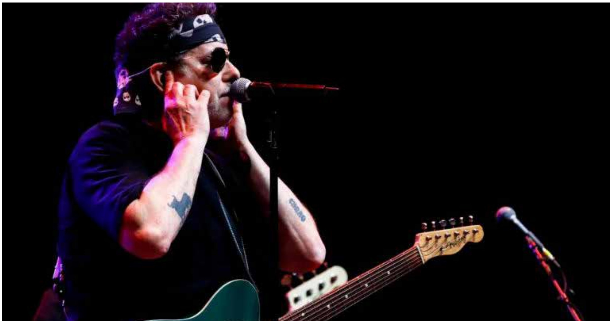
Andrés Calamaro, anunció no volver a Cali

Algunos asistentes reclaman la devolución del dinero por la suspensión del concierto de Andrés Calamaro