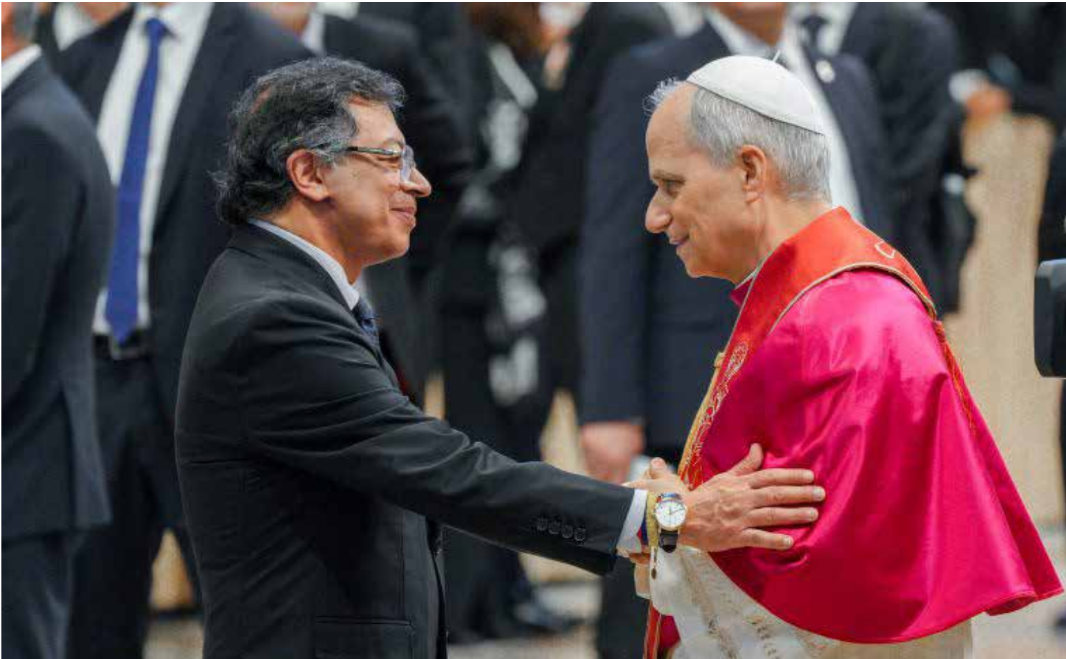
Encuentro inicial entre el Papa León XIV y el presidente Gustavo Petro.

E l presidente Gustavo Petro asistió a la solemne misa de entronización del Papa León XIV en la Basílica de San Pedro, Ciudad del Vaticano, marcando el inicio del pontificado de Robert Prevost. Durante el tradicional «besamanos» posterior a la ceremonia, el mandatario colombiano tuvo su primer encuentro con el nuevo pontífice.