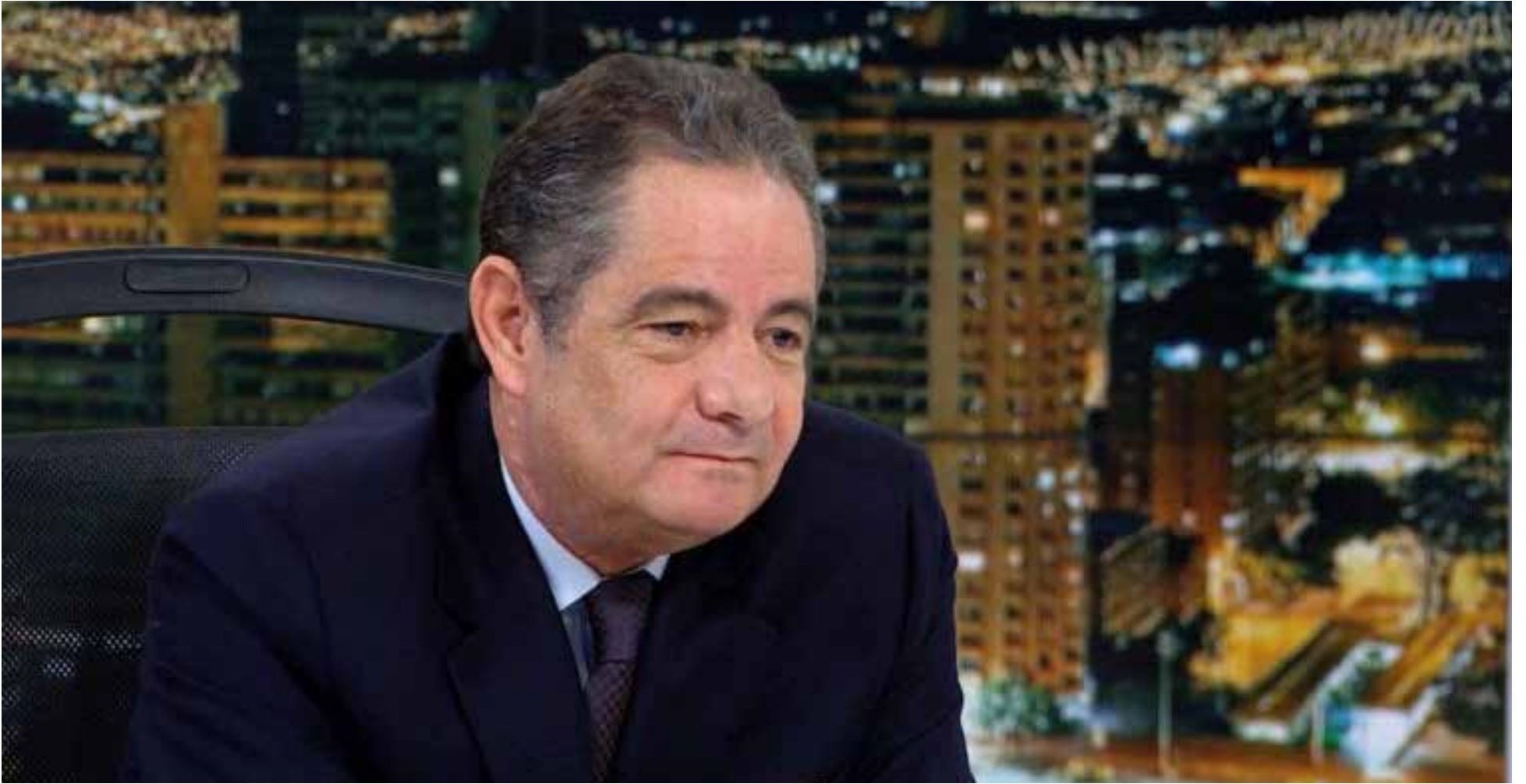
Germán Vargas Lleras en camino a ser el candidato de la derecha colombiana.

La derecha colombiana baraja la candidatura de Germán Vargas Lleras, veterano político y ex vicepresidente, como su principal apuesta para enfrentar al progresismo en las próximas elecciones presidenciales. La opción, que cuenta con el beneplácito de Álvaro Uribe, busca capitalizar el respaldo de Cambio Radical y estrechar lazos con el Partido Conservador y el Partido Liberal, en una coalición anti-petrista impulsada por César Gaviria.