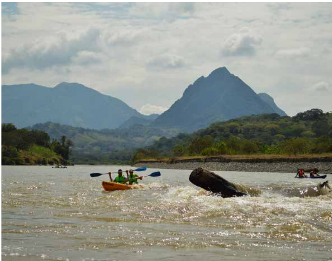
Kayak en río cauca a su paso por el Municipio de la Pintada en Antioquia, al fondo farallones de la Pintada

El impacto más notable del Colectivo ha sido su exitosa gestión ante el Gobierno Nacional, logrando una inversión de 1.7 billones de pesos para la modernización con tratamiento secundario de la PTAR de Cali. Esta planta es crucial, ya que la ciudad aporta el 50% de la contaminación del río en su recorrido inicial por nueve departamentos