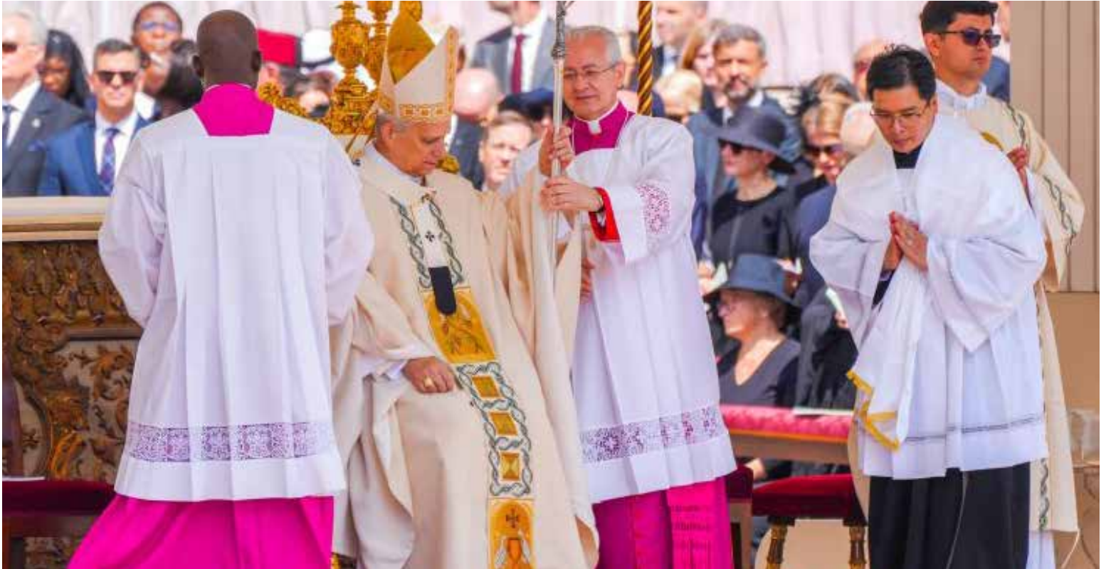
La ceremonia, presidida por el nuevo Pontífice, marca el comienzo de su ministerio como sucesor de Pedro y Obispo de Roma.

Robert Francis Prevost, de 69 años, vivió más de dos décadas en Perú, país del que obtuvo la nacionalidad y donde fue misionero y obispo en Chiclayo, en el norte del país.