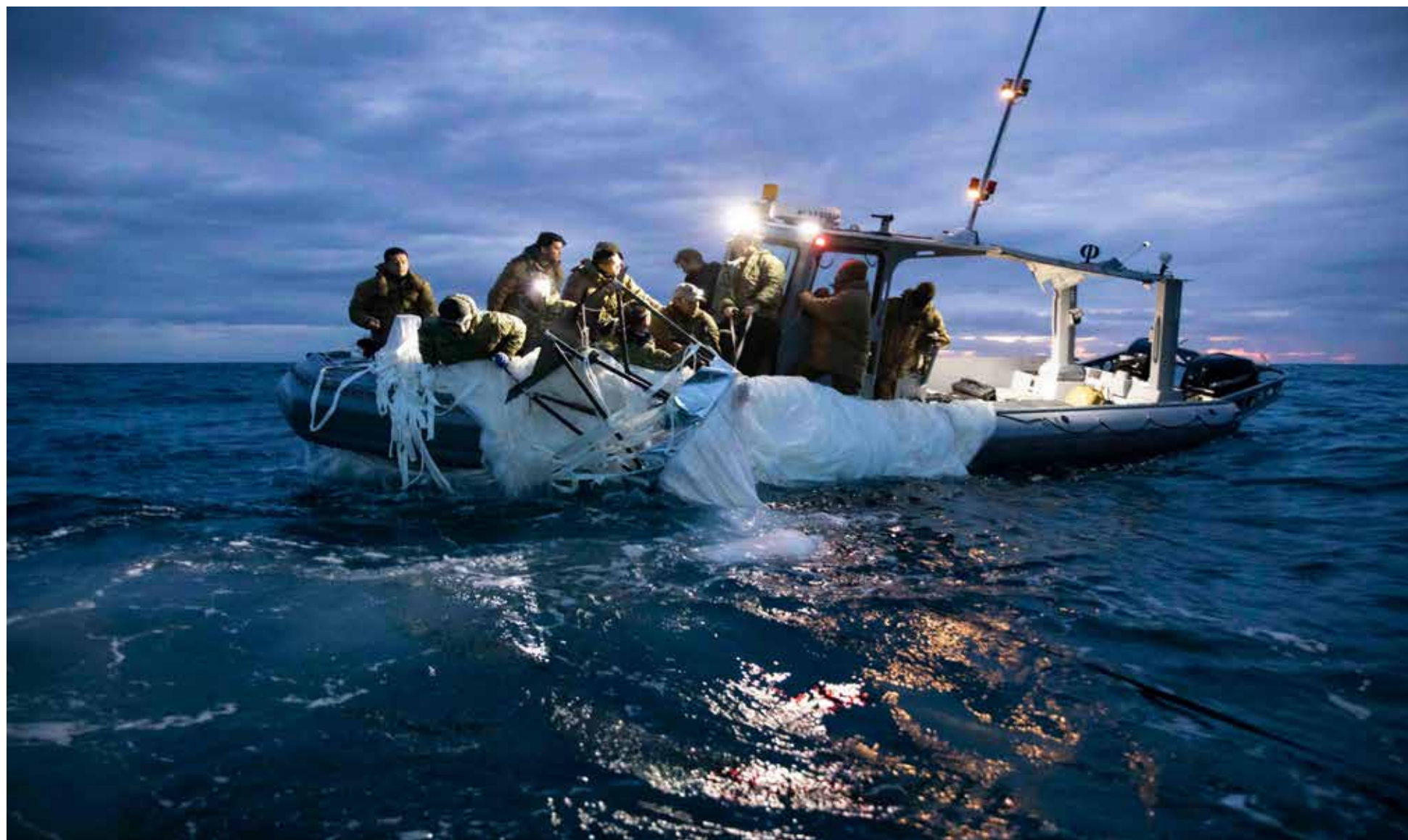
Objeto derribado por los Estados Unidos