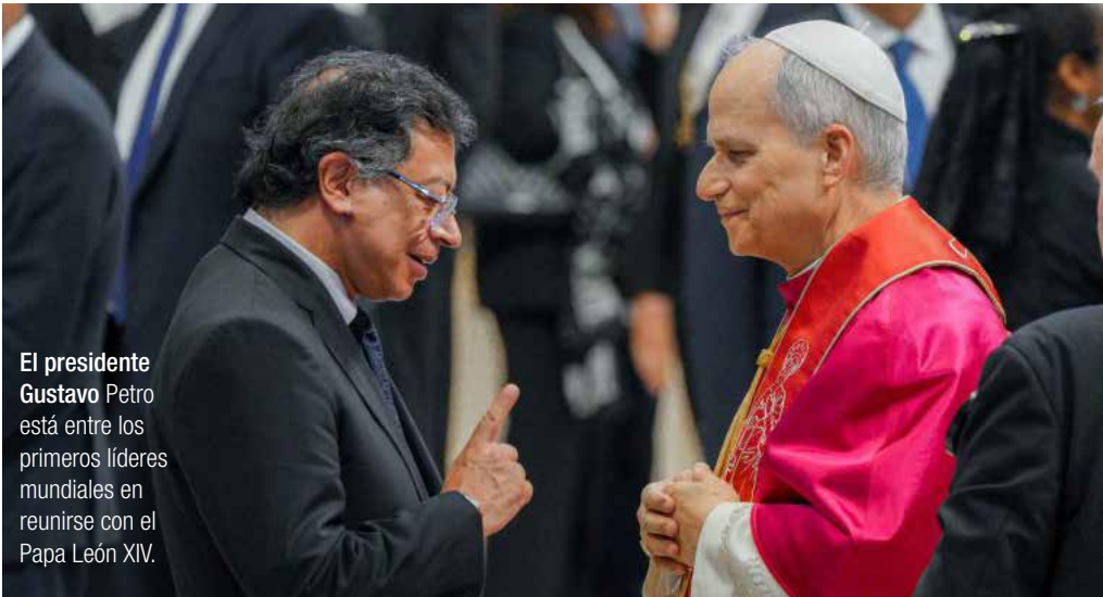
El presidente Gustavo Petro está entre los primeros líderes mundiales en reunirse con el Papa León XIV.