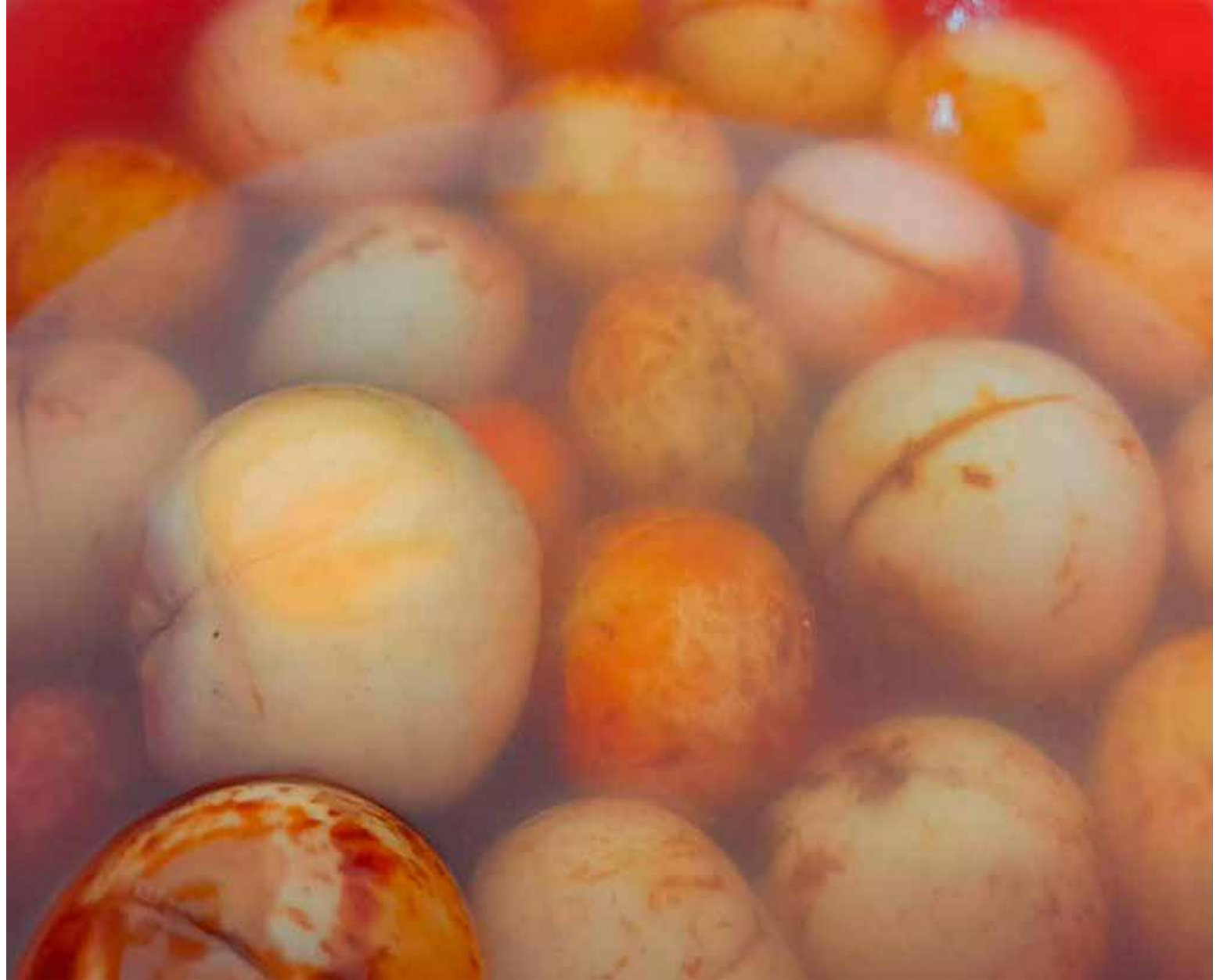
Antes de desecharse, el corazón del aguacate (pepa) tendría una segunda oportunidad.

La innovación de Fuquen va más allá de la simple utilización del almidón. El investigador, con el apo-