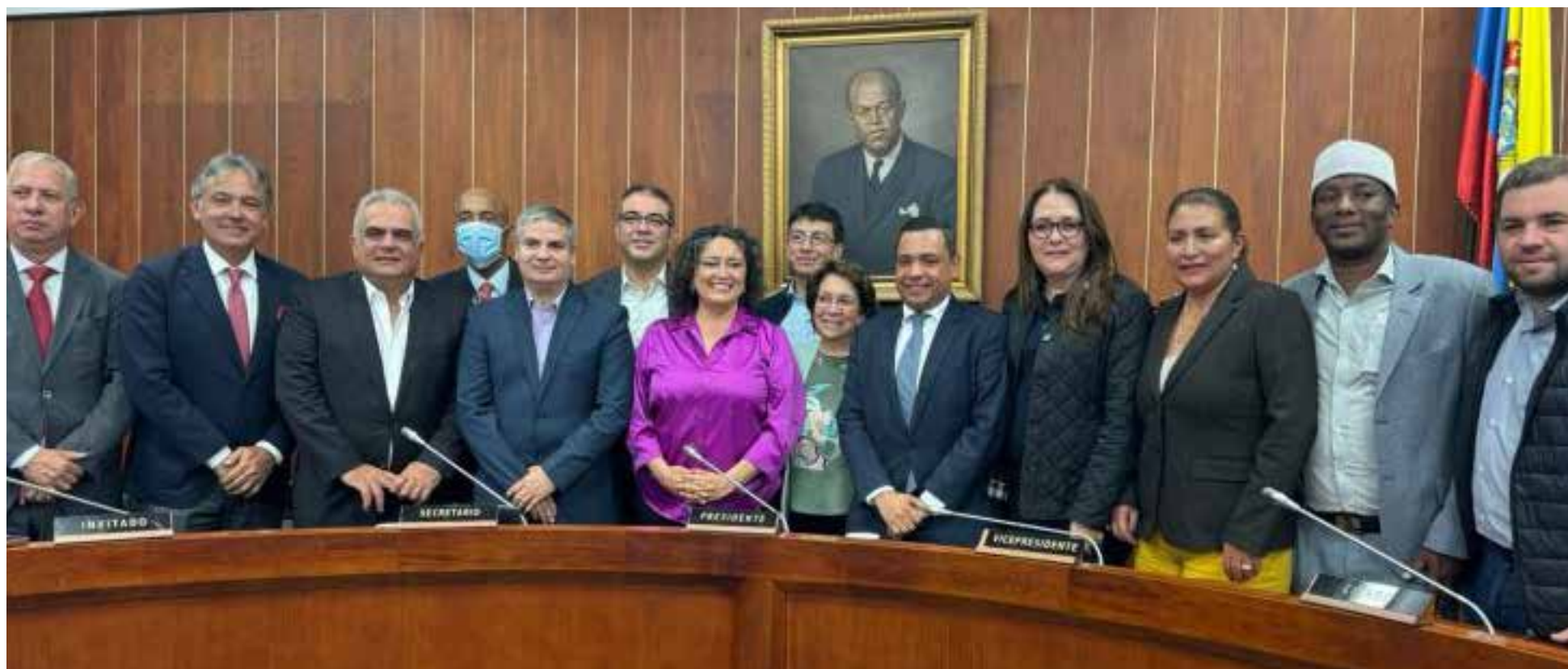
La Comisión Cuarta del Senado con la senadora Angélica Lozano C. como Presidenta y al senador Carlos M. Farelo como Vicepresidente, iniciarán el debate de la Reforma Laboral.

La Comisión Cuarta del Senado de la República se convertirá hoy en el epicentro del debate sobre la reactivada reforma laboral. Con una participación sin precedentes de más de 300 inscritos, la audiencia pública marcará el inicio de un crucial espacio de diálogo entre los diversos actores del mundo laboral colombiano.