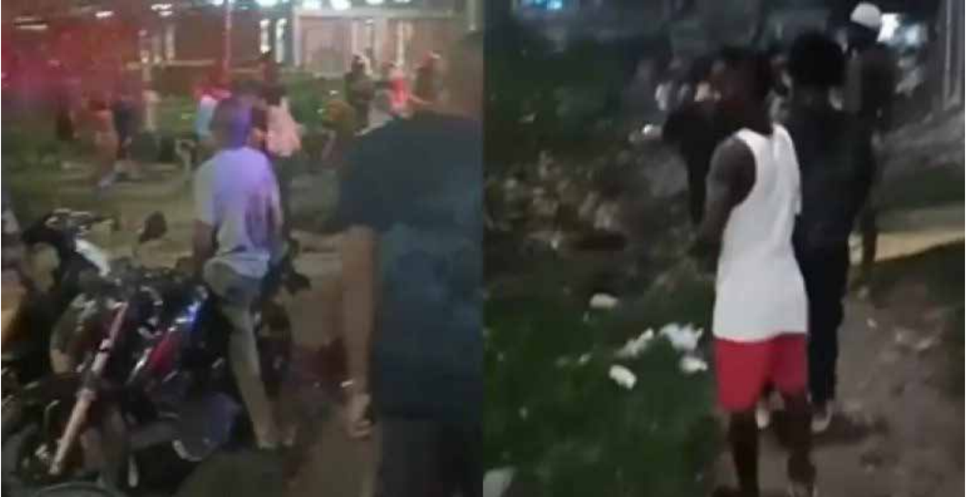
Atentado en Cali deja tres policías heridos